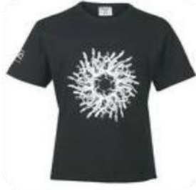
Un T- shirt