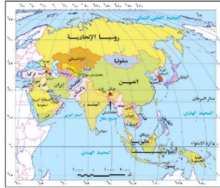
خريطة (٢-ت) آسيا السياسية الآن

(٥) من خلال المقارنة بين الخريطين التاليين يتضح حدوث تغيرات نتجت عن اندماج دول ويظهر ذلك بالقرب من .