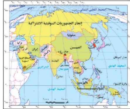
خريطة (١-ت) آسيا قبل تفكك الاتحاد السوفيتي في ديسمبر ١٩٩١م